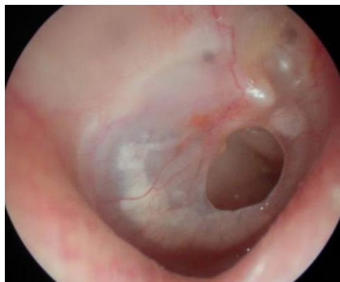
Fig 2: Hul i trommehinden

Såfremt der er opstået et større hul på trommehinden vil mange patienter opleve en række forskellige gener, mens nogle mennesker ikke oplever nogen gener fra hullet. De typiske klager er, at det begynder at flyde med betændelse fra mellemøret, når der kommer vand i øregangen (fordi dette når ind til mellemøret, som skal ellers er sterilt, igennem hullet. Dette behandles med øredråber. Mange patienter oplever mindre høretab ligesom der kan opstå en susen fra øret. Huller i trommehinden giver ikke anledning til problemer i forbindelse med flyvning, mens dykning ikke er muligt med hul i trommehinden, da der ved dykning vil komme havvand ind i mellemøret.